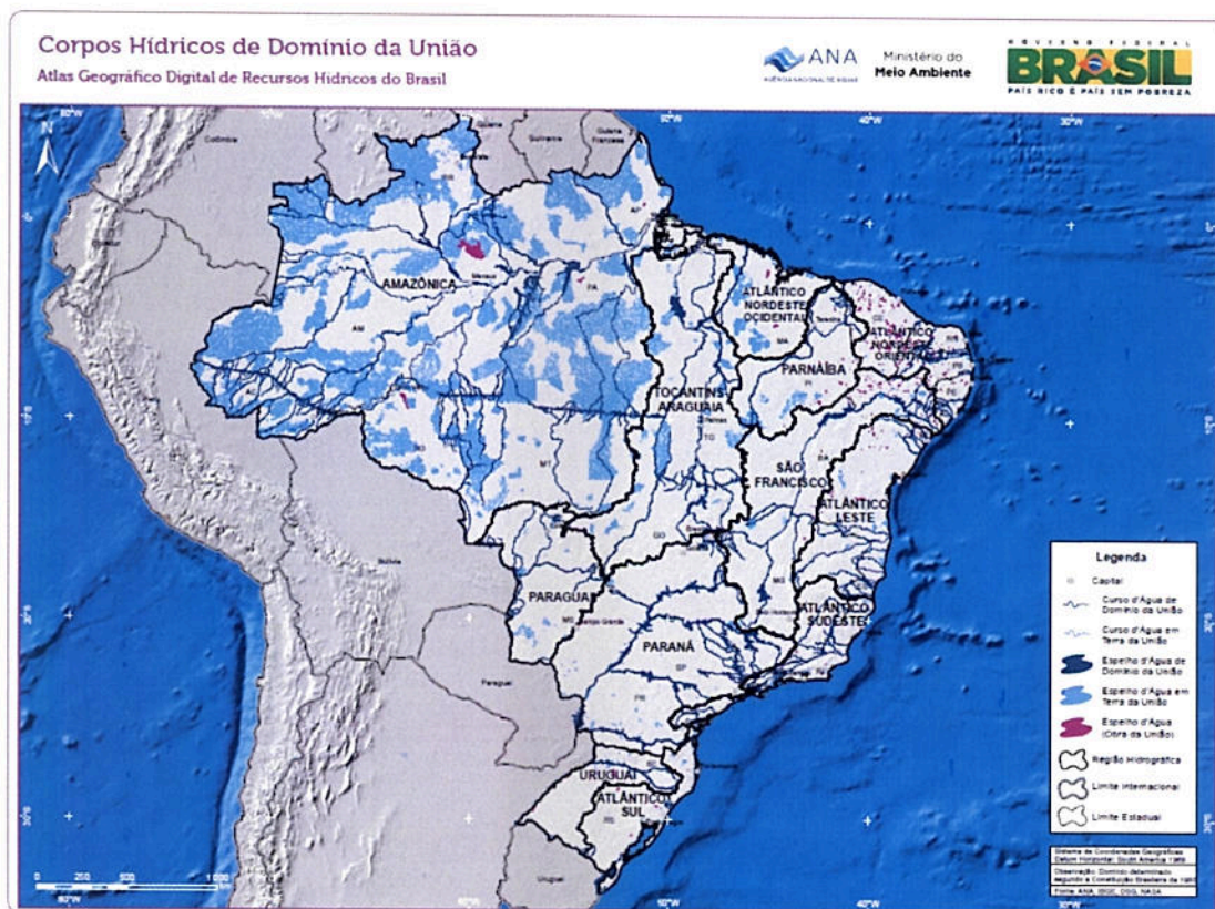
Figura 2: Corpos hídricos de domínio da União (obtido em http://metadados.ana.gov.br - 21/11/13)